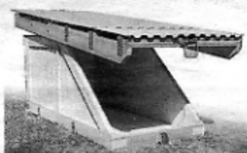
Sinkabirumfällan har fångat tusentals vildsvin.

han kan bli ett värdefullt komplement till det projekt som redan inletts. Enkätsvaren kommer att peka ut ett antal jägare som lyckats långt bättre än genomsnittet med sin fångst. Deras erfarenheter av bland annat fällornas placering, fångstmetodik, beten, lockmedel och avlivning av fångade djur kan då dokumenteras och användas i utbildning.